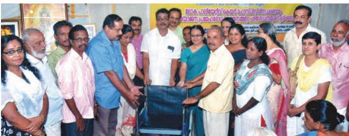
■ ലോക പാലിയേറ്റീവ് കെയർ ദിനാചരണത്തോടനുബന്ധിച്ച് 5 വർഷമായി പരിഷ്കരിച്ച തളർന്ന യുവാവിന്റെ കുടുംബത്തിന് വീൽചെയർ നൽകുന്നു.