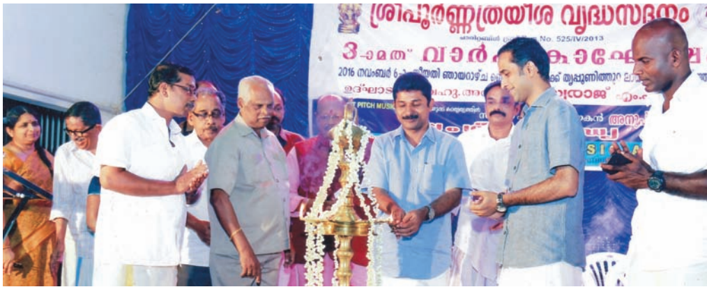
■ 3-ാമത് വാർഷികഘോഷം അഡ്വ. എം. സാരാജ് എം.എൽ.എ. ഉദ്ഘാടനം ചെയ്യുന്നു.