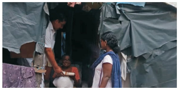
■ പാലിയേറ്റീവ് കെയർ സേവനത്തിന്റെ ഭാഗമായി നിർമ്മന കുടുംബത്തിന് ഓണക്കിറ്റ് നൽകുന്നു.