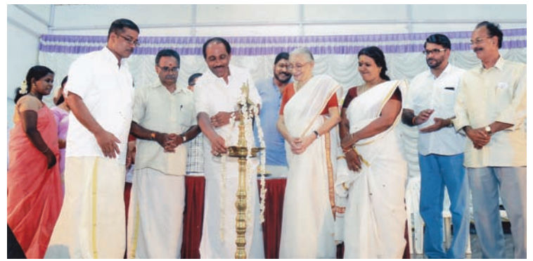
■ 2-ാമത് വാർഷികഘോഷം ശ്രീ. കെ.ബാബു എം.എൽ.എ. ഉദ്ഘാടനം നിർവ്വഹിക്കുന്നു.

Punjab National Bank Tripunithura 4358002100008254 IFSC:PUNB 0435800 State Bank of India N.F Gate, Tripunithura 36240870202 IFSC: SBIN 0004400 ചെക്കുകളും ഡ്രാഫ്റ്റുകളും ശ്രീപുരണ്ണത്രയീശ വൃദ്ധസദനം ചാരിറ്റബിൾ ട്രസ്റ്റ് എന്ന വിലാസത്തിൽ അയയ്ക്കുക ചാരിറ്റബിൾ ട്രസ്റ്റിന് നൽകുന്ന സംഭാവനകൾക്ക് 80G ആനുകൂല്യം ലഭ്യമാണ്