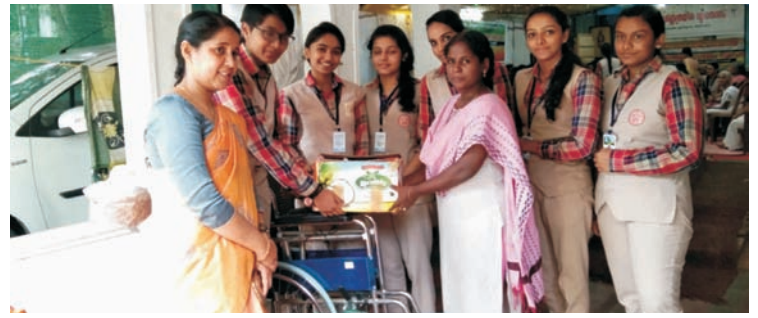
■ തമ്മനം നളന്ദ പബ്ലിക് സ്കൂൾ വിദ്യാർത്ഥികൾ ശ്രീപുരണ്ണത്രയീശ പാലിയേറ്റീവ് കെയറിന്റെ പ്രവർത്തനങ്ങൾക്ക് വീൽ ചെയർ നൽകുന്നു.