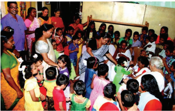
തൃപ്പൂണിത്തുറ RLV UP സ്കൂളിലെ വിദ്യാർത്ഥികൾ അമ്മമാരോടൊപ്പം ഒരു ദിനം ആഘോഷിക്കുന്നു.