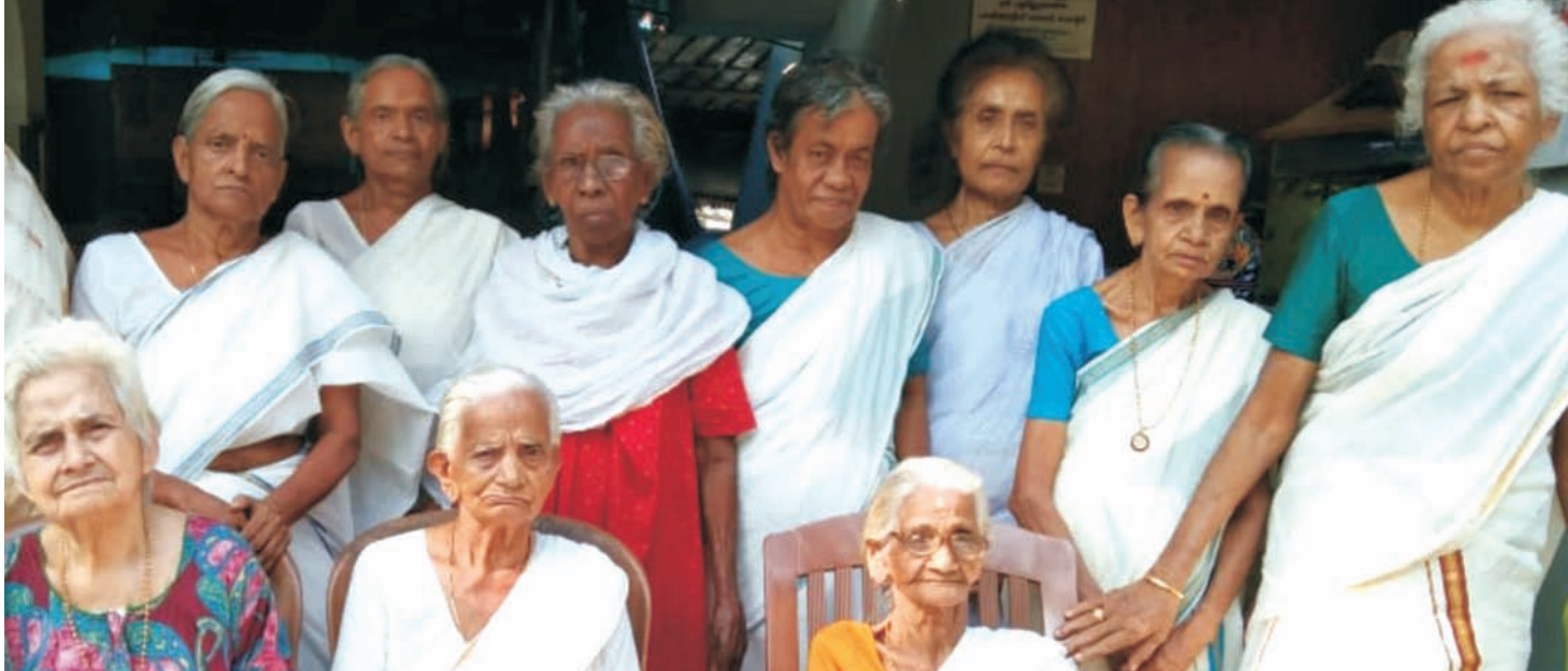
■ ശ്രീപൂർണ്ണത്രയീശ വൃദ്ധസദനത്തിലെ അമ്മമാർ

ഉപേക്ഷിച്ച ഒരു വൃദ്ധമാതാവിനെ ഏറ്റെടുത്ത് ശ്രീപൂർണ്ണത്രയീശ വൃദ്ധസദനത്തിലെ പ്രവർത്തകർ സംരക്ഷിച്ച സംഭവം വാർത്ത മാധ്യമങ്ങളുടെ പ്രശംസ നേടിയിരുന്നു. സമൂഹത്തിൽ ആർക്കും വേണ്ടാത്തവരെ സ്വന്തം പ്രയത്നം കൊണ്ടും സുമനസ്സുകളായ മനുഷ്യസ്നേഹികളുടെ സഹായം കൊണ്ടും സംരക്ഷിക്കുക എന്നത് അത്ര എളുപ്പമായ കാര്യമല്ല. വസ്ത്രം, ഭക്ഷണം, സാന്ത്വനം, സ്നേഹപൂർവ്വമായ ഇടപെടൽ, ആവശ്യമായ മെഡിക്കൽ സഹായം എന്നിവയെല്ലാം ശ്രീപൂർണ്ണത്രയീശ വൃദ്ധസദനത്തിന്റെ പ്രത്യേകതയാണ്. പാലിയേറ്റീവ് സാന്ത്വനരംഗത്തും മികച്ചരീതിയിൽ പ്രവർത്തിക്കുന്ന ഈ സ്ഥാപനം ദൈനംദിന കാര്യങ്ങൾ പോലും നടത്തിക്കൊണ്ടുപോകുവാൻ ബുദ്ധിമുട്ടുമ്പോഴും പൊതുസമൂഹത്തിൽ അവശതയനുഭവിക്കുന്നവരെ സഹായിക്കുവാൻ കാണിക്കുന്ന മനോഭാവം ശ്ലാഘനീയമാണ്. ജാതിമത വർഗ്ഗ വർണ്ണ വ്യത്യാസമില്ലാതെ അവശതയനുഭവിക്കുന്ന, സമൂഹം തിരസ്കരിക്കുന്ന വൃദ്ധരെ ഏറ്റെടുത്ത് പരിപാലിക്കുന്ന ഈ പ്രസ്ഥാനം കൂടുതൽ നന്നായി, വിപുലമായി തീരേണ്ടത് സമൂഹത്തിന്റെ ആവശ്യകത കൂടിയാണ്. 6-ാമത് വാർഷികം ആഘോഷിക്കുന്ന ഈ വേളയിൽ സ്വന്തമായി ഒരു ആസ്ഥാനം ഉണ്ടാക്കുവാൻ ഒരു എളിയ ശ്രമം ആരംഭിക്കുന്ന ശ്രീപൂർണ്ണത്രയീശ വൃദ്ധസദനത്തിന്റെ പ്രവർത്തകരെ അഭിനന്ദിക്കുന്നു. നിങ്ങളുടെ ഈ പ്രയത്നങ്ങൾക്ക് ഈശ്വരാനുഗ്രഹവും എല്ലാ നന്മകളേയും പ്രോത്സാഹിപ്പിക്കുന്ന പൊതുസമൂഹത്തിന്റെ മുഴുവൻ പിന്തുണയും ഉണ്ടാകും എന്നകാര്യം തീർച്ചയാണ്. എല്ലാ മതഗ്രന്ഥങ്ങളും പ്രകീർത്തിക്കുന്ന “മാതാ-പിതാ -ഗുരു-ദൈവം” എന്ന മഹനീയ ആശയം മറന്നുപോകുന്ന ഒരു സമൂഹത്തെ അത് ഓർമ്മിപ്പിക്കുകയും, പ്രസംഗമല്ല പ്രവർത്തനമാണ് വേണ്ടത് എന്ന് ബോധ്യപ്പെടുത്തുകയും ചെയ്യുന്ന ശ്രീ. ഗോപാൽ ജിയും പത്നി ലീനയും ശ്രീപൂർണ്ണത്രയീശ വൃദ്ധസദനത്തിന്റെ എല്ലാ പ്രവർത്തകരും അനുഭാവം അർഹിക്കുന്നു.